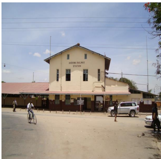
Stesheni ya Dodoma