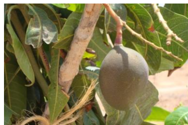
Maembe bora ambalo hufikia uzito wa kilo mbili