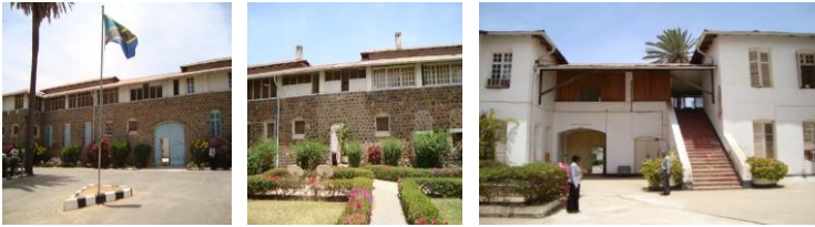
Jengo lililokuwa ngome ya Dk. Sperling