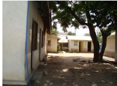
Jengo la iliyokuwa ofisi ya utawala