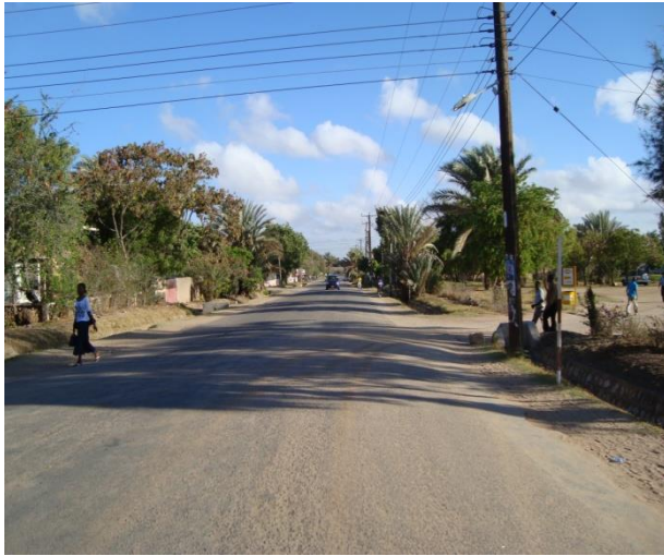
Picha ya barabara mojawapo mjini kati

Barabara hizo zitakapokamilika kwa kiwango cha lami zitarahisisha usafiri vilevile kufunguka kwa masoko na kupanuka kwa biashara, kwani mkoa wa Dodoma upo katikati ya nchi.