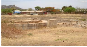
Eneo alilozama tembo

Mji wa Dodoma ulitangazwa rasmi kuwa makao makuu ya Chama na Serikali chini ya kifungu cha sheria No.320 ya mwaka 1973. Baada ya hapo matukio ya mafanikio yalifuata. Mwaka 1980 mji wa Dodoma ulipewa hadhi ya kuwa Manispaa. Mwaka 1995 serikali iliamua kuwa shughuli zote za bunge zifanyikie Dodoma. Bunge lilianza shughuli zake rasmi mwezi Februari 1996.