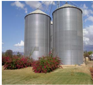
Kiwanda cha mvinyo CETAWICO na tanki za kuhifadhia mvinyo