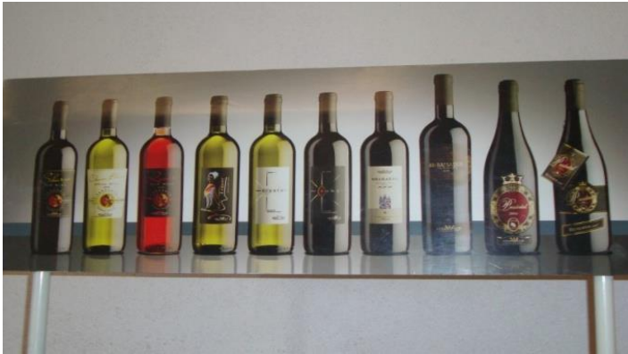
Aina za mvinyo ambazo hupatika kiwandani hapo