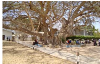
Mti uliotumiwa kunyongea wahalifu