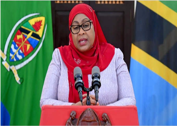
Rais, Dkt. Samia Suluhu Hassan