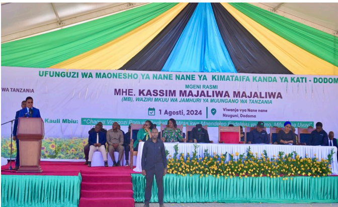
Waziri Mkuu akiwa katika Ufunguzi wa Maonesho ya Nanenane, Nzuguni-Dodoma

WAZIRI Mkuu wa Jamhuri ya Muungano wa Tanzania Kassim Majaliwa amewataka watanzania kutumia haki yao ya kikatiba ya kupiga kura na kwamba ili waweze kutumia haki hiyo wanatakiwa kuhakiki majina yao katika daftari la kudumu la wapiga kura.