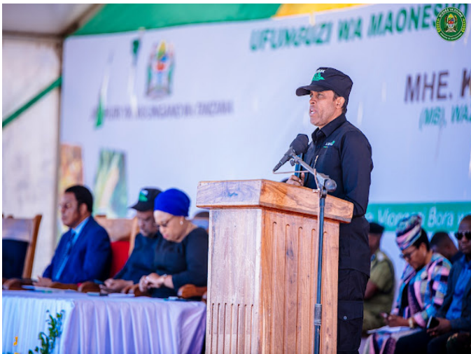
Waziri wa Kilimo, Hussein Bashe

WAZIRI wa Kilimo, Hussein Bashe amesema serikali itaendelea kufanya maboresho katika viwanja vya maonesho ya Nanenane ikiwa ni mkakati wa kuchangia ukuaji wa uchumi nchini.