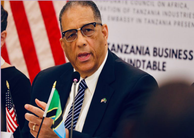
Balozi wa Marekani nchini Tanzania