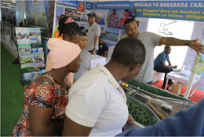
Wananchi wakipewa elimu katika banda la TANROADS, Nzuguni-Dodoma